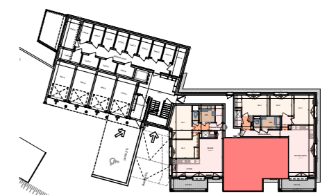
Plan de repérage du RDC

LEGENDE: PF: Porte-fenêtre F: Fenêtre VB: Volet battant VR: Volet roulant Dep: Descente des eaux pluviales HSP - HSFP - HSF: Hauteur sous plafond ou faux-plafond, sous flocage. Hauteur mentionnée seulement si différente de la hauteur standard = 2.45m.